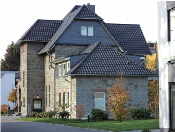
Bahnhof Oberwiehl (2015)