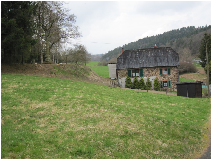
Blumsmühle in Gunderath (2010)