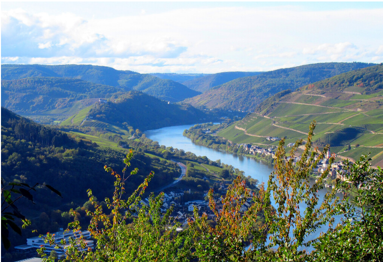
Blick vom Weinberg-Wanderweg "Collis Steilpfad" auf die Mosel und den Zeller Stadtteil Merl rechts im Bild (2020).