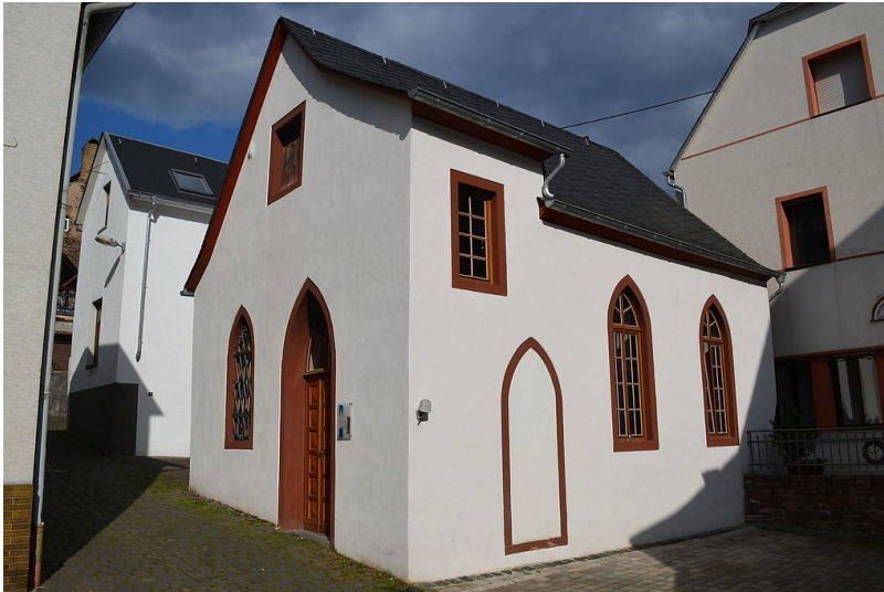
Außenansicht der Synagoge Ediger-Eller in der Rathausstraße (2015).