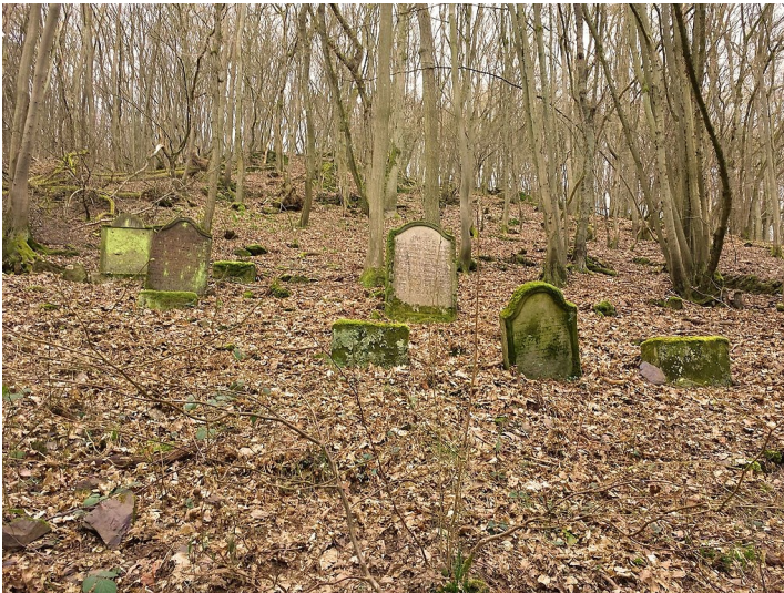
Grabsteine des älteren Judenfriedhofs "an der Knippwiese" in Cochem an der Mosel (2014).