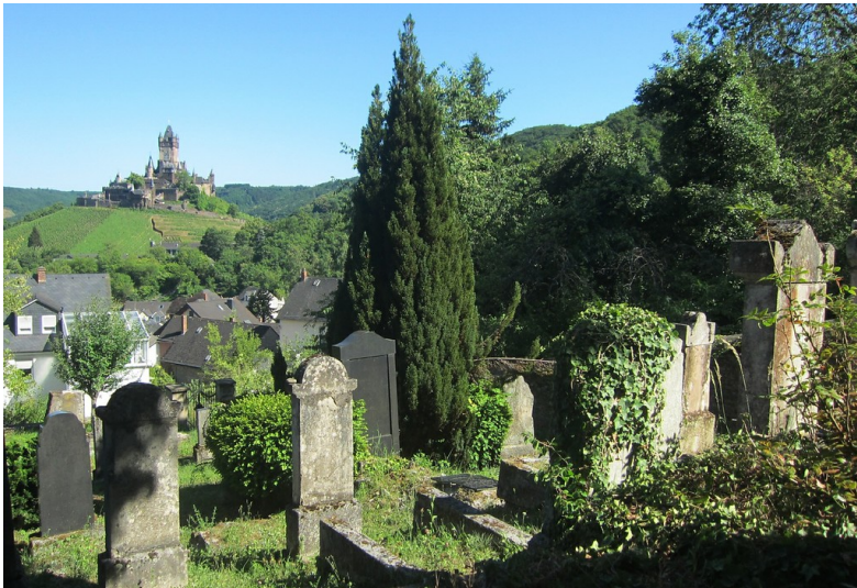
Das Gräberfeld auf dem neuen Judenfriedhof in Cochem, Kelberger Straße (2015). Links im Hintergrund die Reichsburg Cochem.