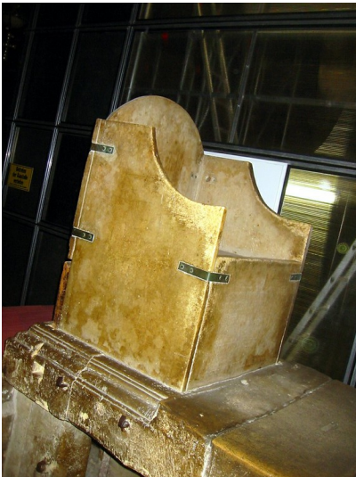
Karlsthron im Dom zu Aachen (2008)