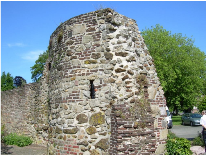
Verlorenenturm in Wassenberg (2010)