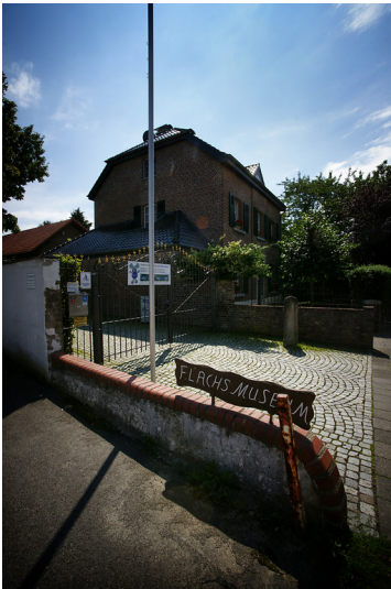
Der Eingangsbereich zum Flachsmuseum in Wegberg-Beeck (2011).