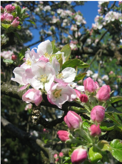
Blüte des Luxemburger Triumph (2008)