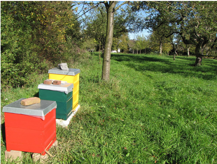
Der Bienenstand am Rande der Obstwiese in Nümbrecht-Hömel sorgt dafür, dass gerade bei wenigen sonnigen Stunden zur Blütezeit die Honigbienen für eine rasche Bestäubung und gesicherte Ernte sorgen (2010).