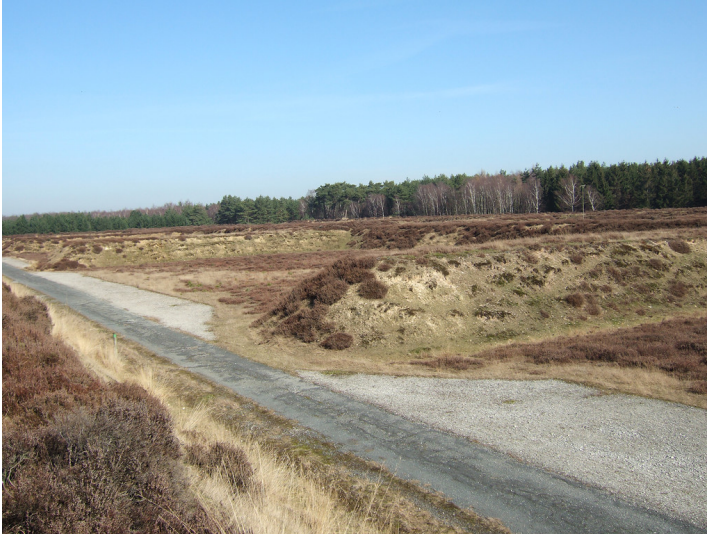
Lagerplätze für Fliegerbomben im Munitionsdepot Bracht (2013)