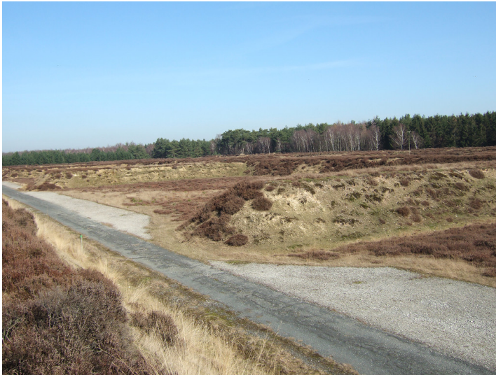
Lagerplätze für Fliegerbomben im Munitionsdepot Bracht (2013)