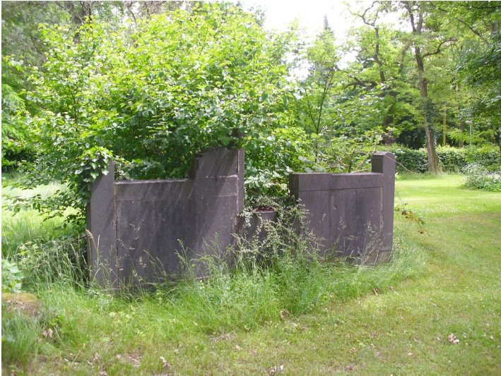
Ein Grabstein auf dem alten Friedhof "Poller Damm" in Köln-Poll (2013).