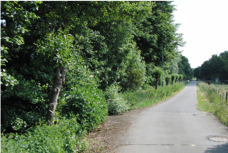
Kopfweidenreihe am Sportplatz in Niedermerz (2013)