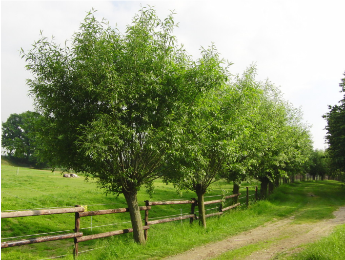
Eine besonnte Kopfweidenreihe an einer Pferdekoppel bei Titz-Opherten (2013).