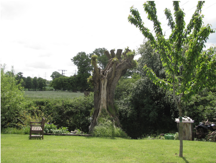
Frischgeschnittene alte Kopfweide in einem sonnigen Garten in Düren-Birgel (2013)