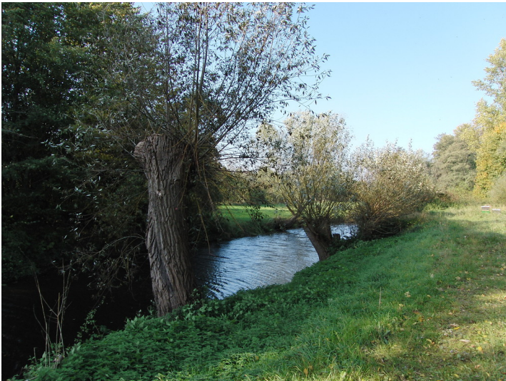
Kopfbaumreihe am Mühlenteich bei Selhausen (2011)