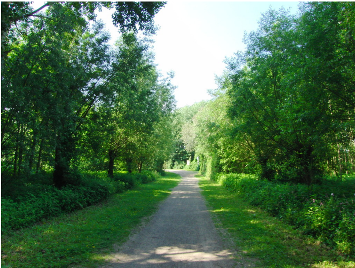
Kopfweidenallee am Barmener See bei Jülich (2013)