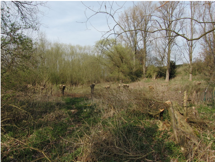
Frisch geschnittene Kopfweiden im "Brüchelchen bei Linnich-Ederen (2012)