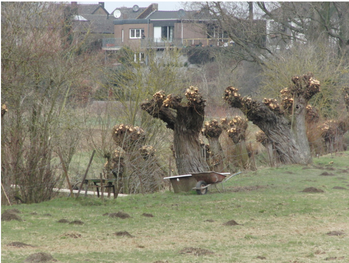
Eine Wiese mit frisch geschnittenen Kopfweiden bei Linnich-Merzbach (2013).