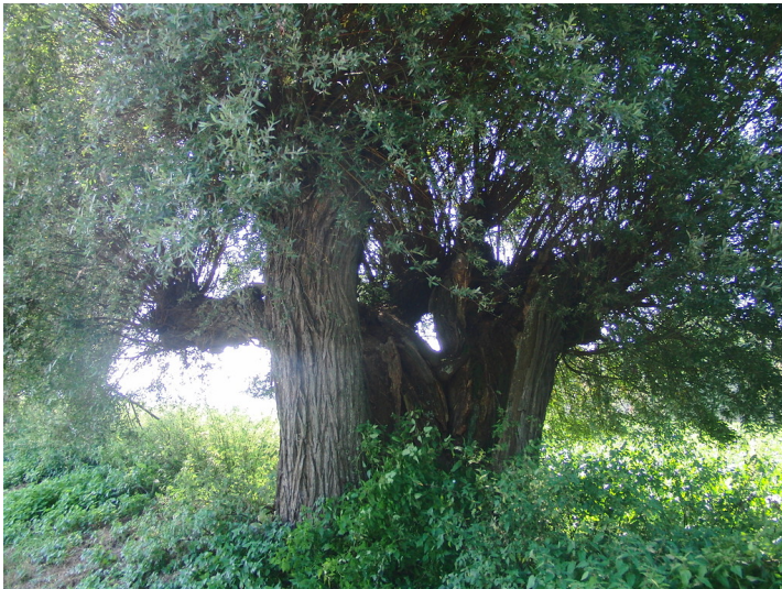
Altehrwürdige Kopfweide am Malefinkbachgraben in Körrenzig-Ederen (2011)