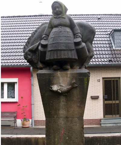
Milchmädchen Denkmal in Köln-Poll (2013)