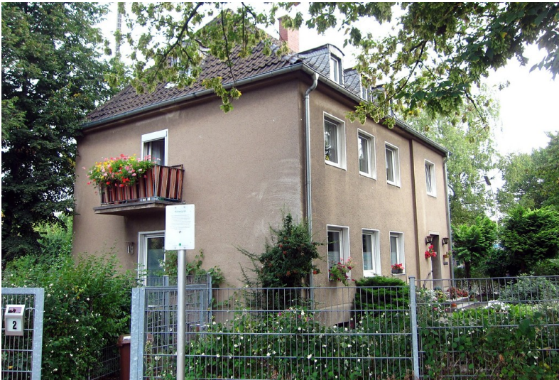
Das heutige Wohnhaus Kaulardstraße 2 in Efferen, in dessen Keller sich die römische Grabkammer befindet (2013).