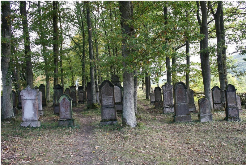
Ansicht des jüdischen Friedhofs auf dem Burgberg bei Beilstein (2012).