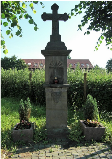
Wegekreuz an der Rolshover Straße, im Hintergrund der Rolshover Hof (2013)