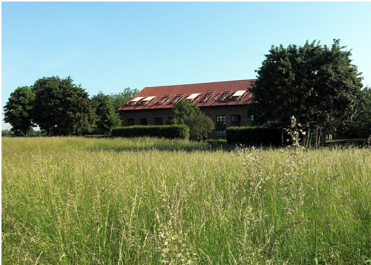
Rolshover Hof aus südlicher Richtung (2013)