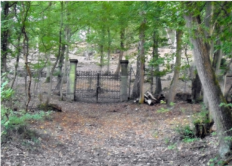
Eingang zum jüdischen Friedhof Boppard-Buchenau (2009)