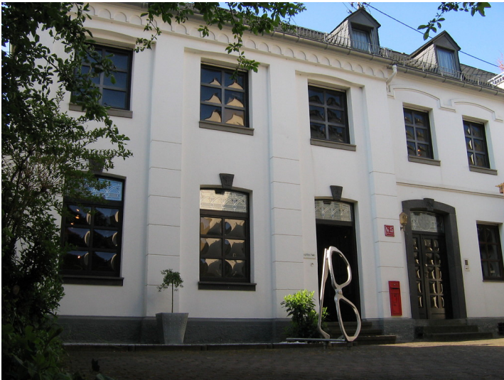
Außenansicht der ehemaligen Synagoge in Boppard (2008)