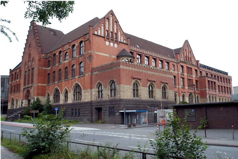
Alte Thyssen-Hauptverwaltung in Duisburg-Marxloh/Bruckhausen (2005)