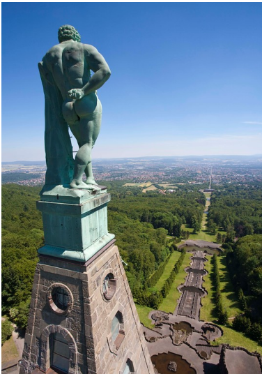
Blick auf den Herkules im Bergpark Wilhelmshöhe (2010). Das Bauwerk gilt als Wahrzeichen von Kassel, der Bergpark gehört seit 2013 zum UNESCO-Weltkulturerbe.