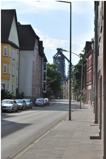
Dieselstraße in Duisburg-Bruckhausen (2012)