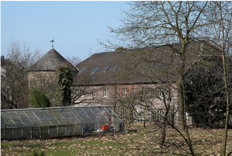
Haus Unterbach in Unterfeldhaus bei Erkrath (2016).