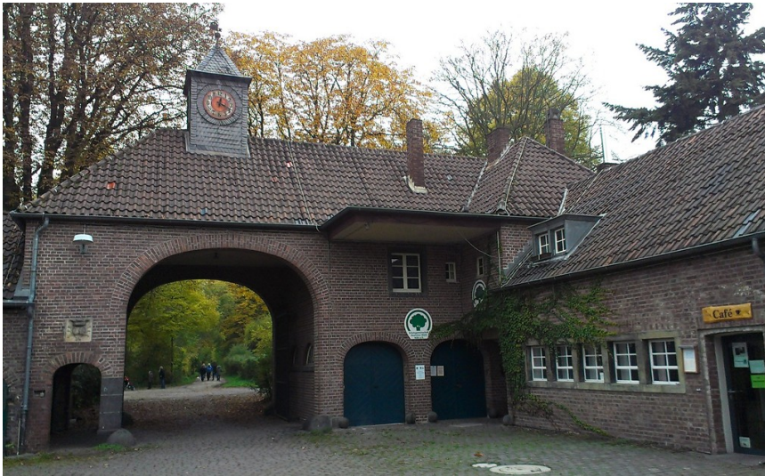
Blick vom Innenhof von Gut Leidenhausen auf das westliche Portal (2015).