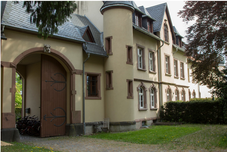
Haupttor des Gut Mielenforst (2013)