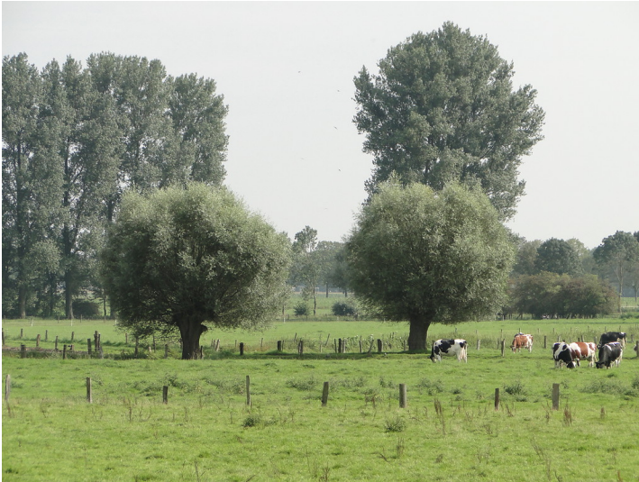
Grünland mit Kopfbäumen und weidenden Rindern - ein typisches Bild der Kulturlandschaft im Uedemerbruch (2011)