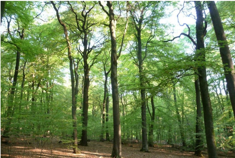
Das Bild zeigt einen Blick in die Naturwaldzelle Geldenberg (2010); zu sehen ist ein struktureicher Bestand.