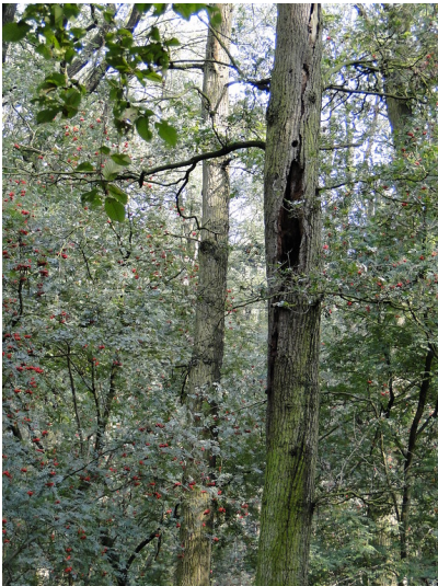
Höhlenbaum in einem Wald im Uedemerbruch (2011).