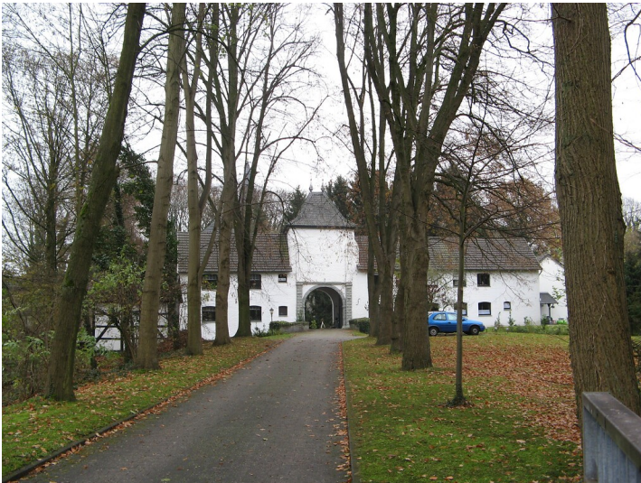
Haus Beeck in Wegberg-Beeck (2009)