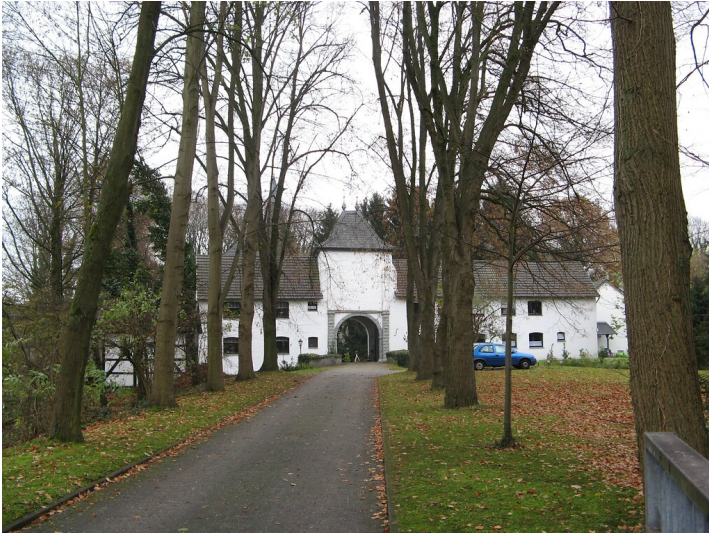
Haus Beeck in Wegberg-Beeck (2009)