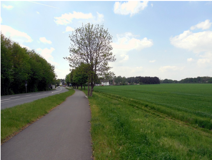
Offenlandflächen zwischen Mauspfad und Lützerather Straße in Köln-Rath/Heumar (2015)