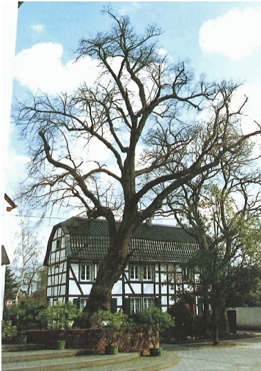
Winterlinde an der Kirche St. Ägidius (Naturdenkmal) in der Oberdreeser Straße in Rheinbach-Oberdrees (Aufnahme vor 1991)