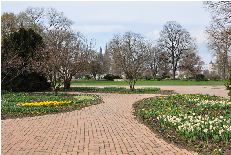
Teil des Blumenhofs im Rheinpark im Frühjahr 2013