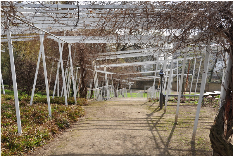
Teil der Laubengänge der Wasserterrassen (2013)