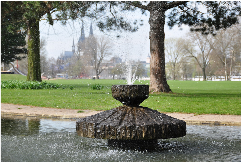
Adenauerweiher mit Kronenbrunnen (2013)