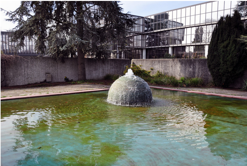
Brunnenanlage von Walter Polak und Hannelore Wiese und im Mittelmeergarten 2013