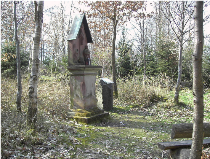
Das Pest-Gelöbniskreuz "Spitzes Kreuz" im Suhrbüsch bei Kelberg mit einer Infotafel des Eifelvereins (2008).