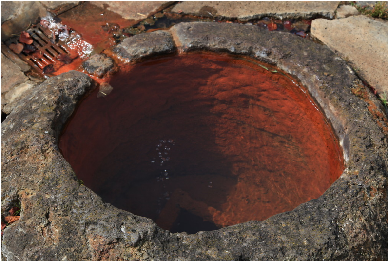
Die aufgrund ihres hohen Eisengehalts rötlich gefärbten Ablagerungen des Mineralwassers der Kohlensäurequelle Bodenbacher Drees (2011).