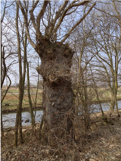
Kopfeiche zwischen dem Feldweg und der Niers südlich der historischen Schlossanlage Kalbeck (2013)