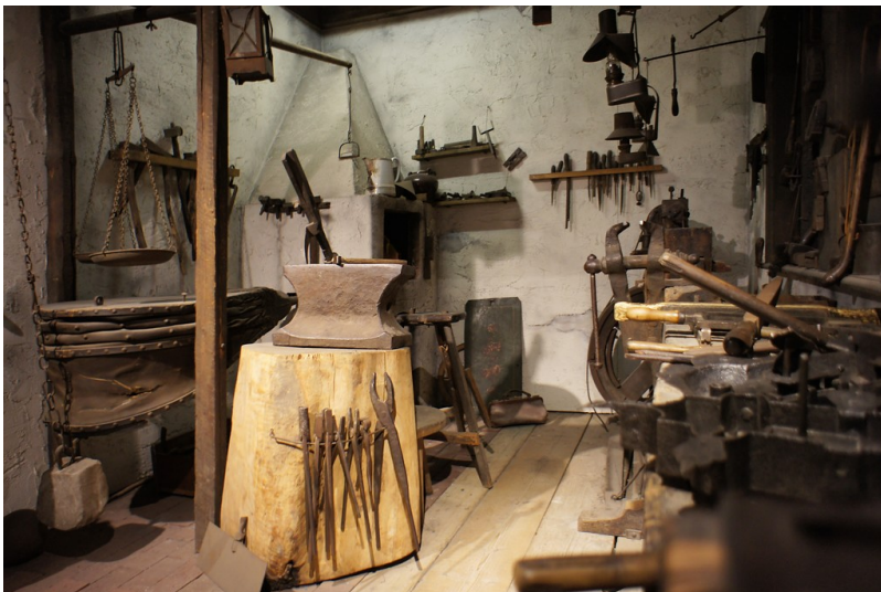
Wönnemannsche Schmiede im Deutschen Schloss- und Beschlägemuseum Velbert (2012)