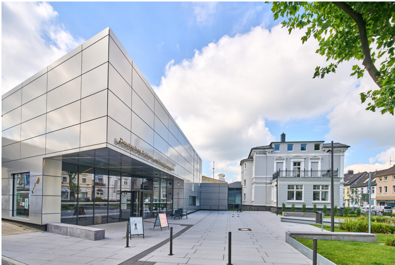
Deutsches Schloss- und Beschlägemuseum Velbert, rechts im Bild die Fabrikantenvilla Herminghaus (2022).