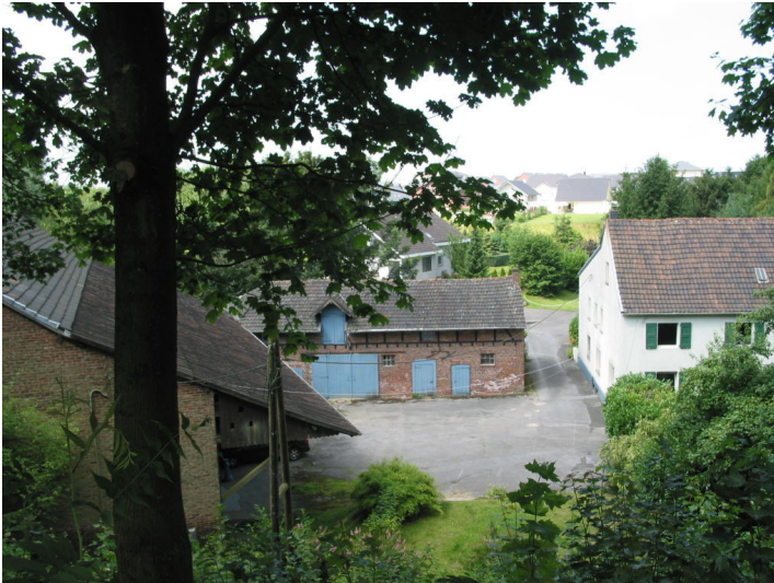
Hof Karpendelle in Mettmann vom Düsselring aus gesehen (2012)