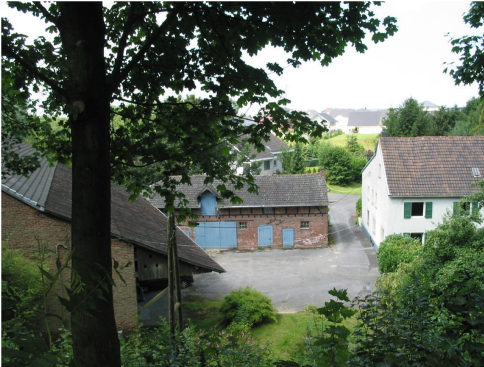
Hof Karpendelle in Mettmann vom Düsselring aus gesehen (2012)