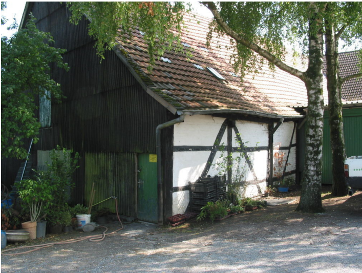
Hof Katers (2012)